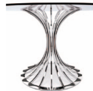
Table ronde sur une base métallique balayée et passée au bichromate de potasse satiné, le dessus est en verre trempé transparent ou gris (épaisseur 12mm). Chaque élément est équipé d'un dispositif de réglage pour régler le positionnement du dessus. Chaque élément est vissé sur la base. Un design abouti. Cerise sur le gâteau, cette table est numérotée. Une pièce d'exception pour les collectionneurs.