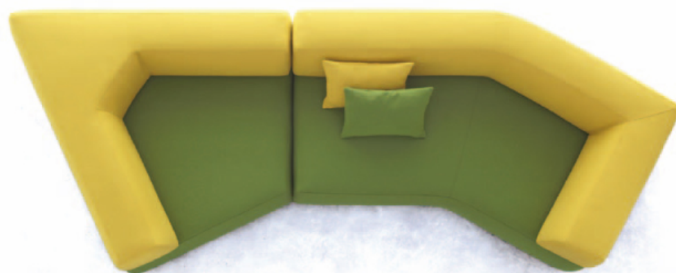
MELT pour BONALDO

Petit fauteuil avec le rembourrage en polyuréthane expansé revêtu en tissu, en cuir écologique ou peau. Base en métal chromé. Il n'est pas déhoussable. Exécution artisanale, pièce numérotée.