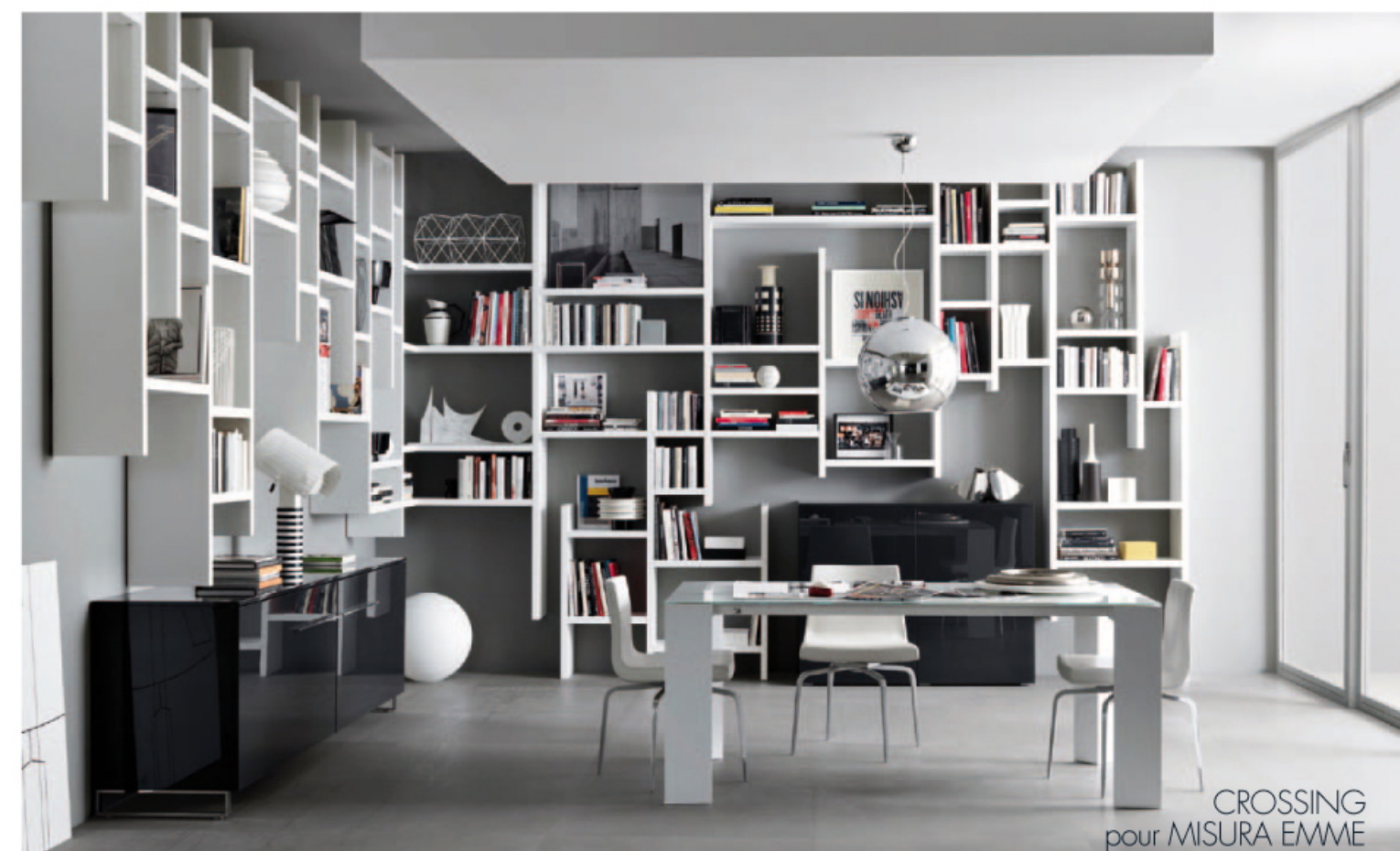
CROSSING pour MISURA EMME

Une vraie innovation réinvente le concept de la bibliothèque. Les panneaux qui la composent, en se libérant de leur poids, permettent au rayonnage d'être suspendu, en donnant un sens de "légèreté visuelle".