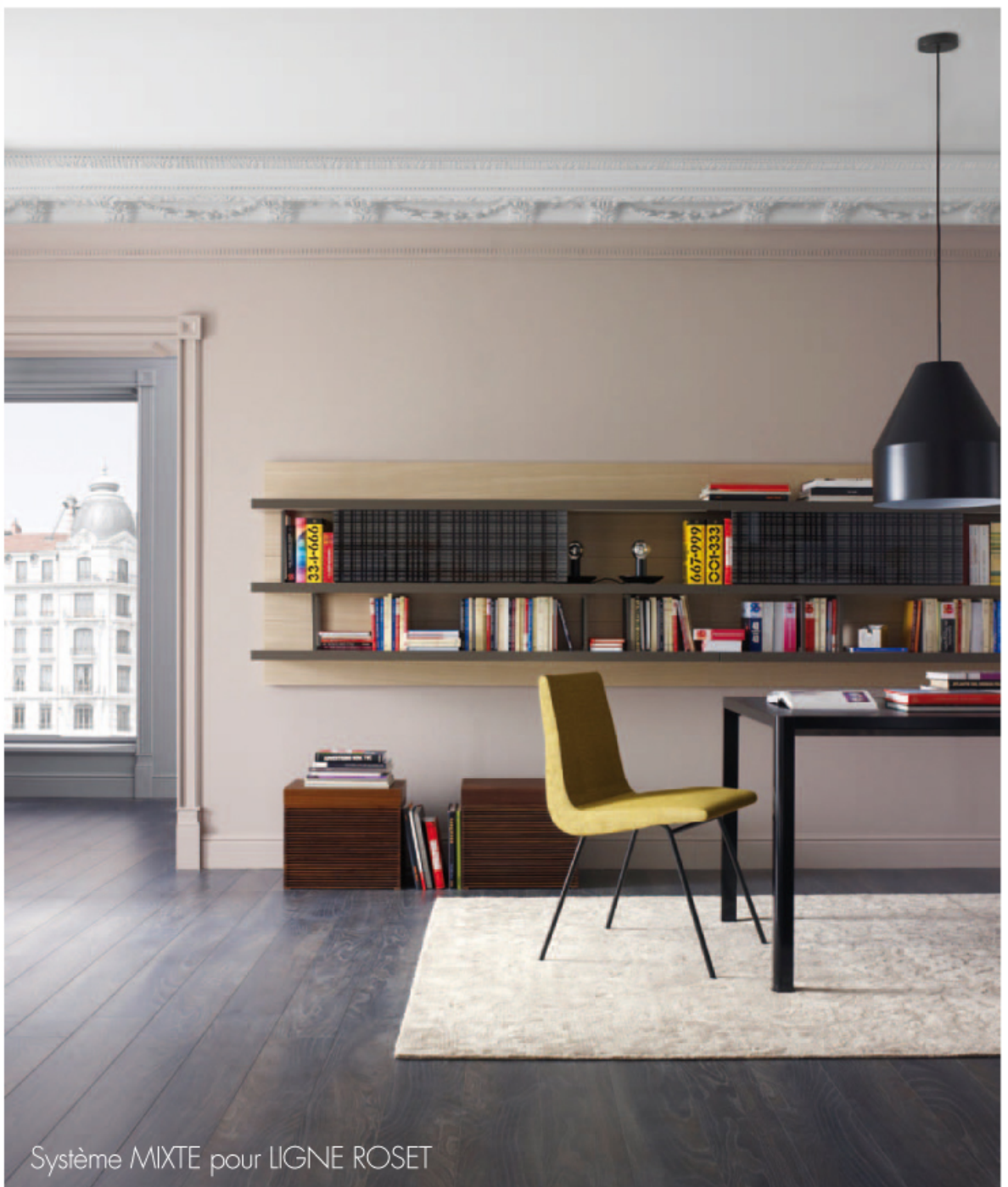
Système MIXTE pour LIGNE ROSET