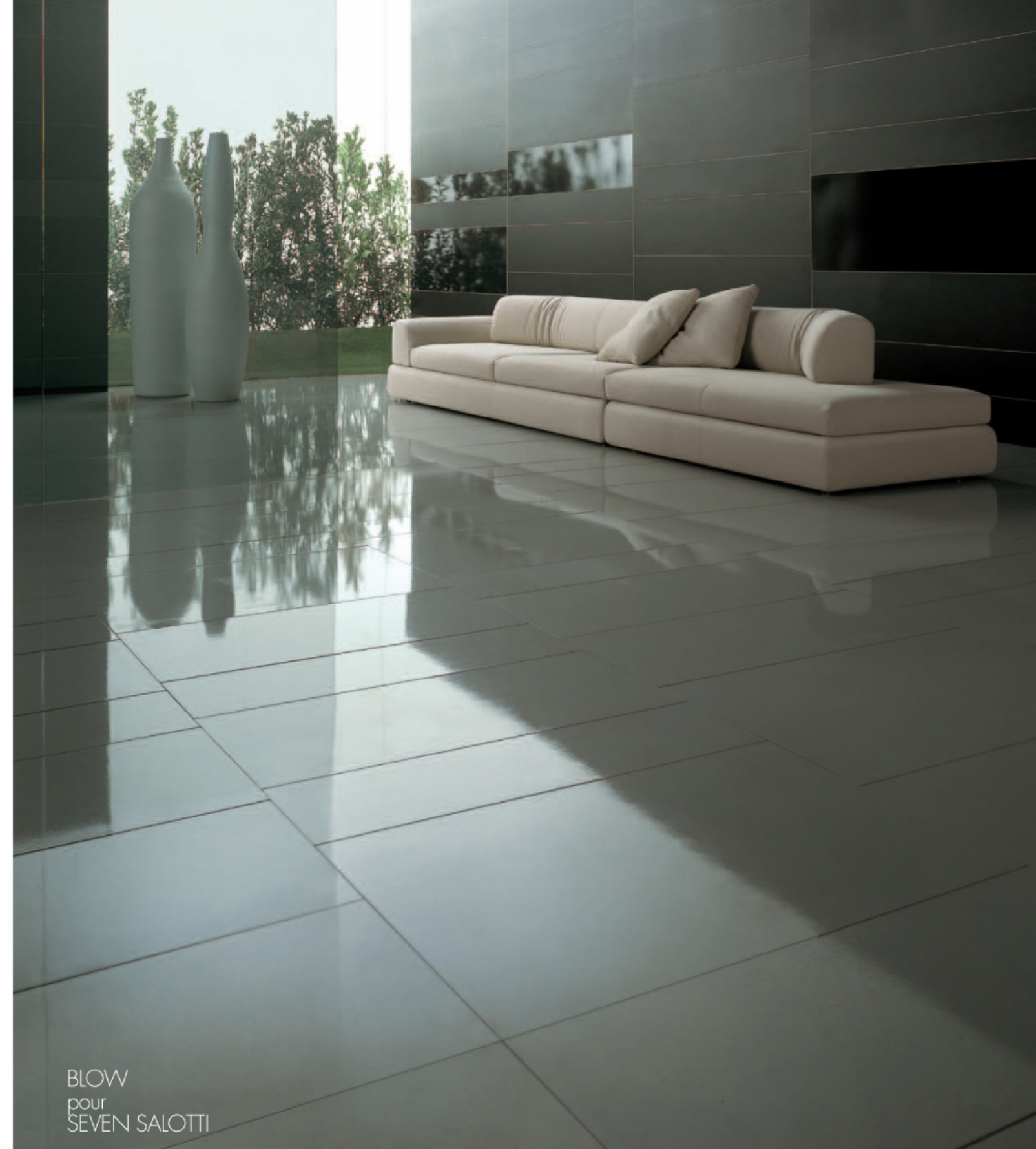
BLOW pour SEVEN SALOTTI

Formes et volumes pour cette collection de sofas et fauteuils. Les volumes se combinent à une très grande flexibilité, nous invitant à créer de nombreuses compositions, améliorées par un grand choix de couleurs et de finitions. Une combinaison dynamique et particulièrement confortable, appropriée à n'importe quel espace.