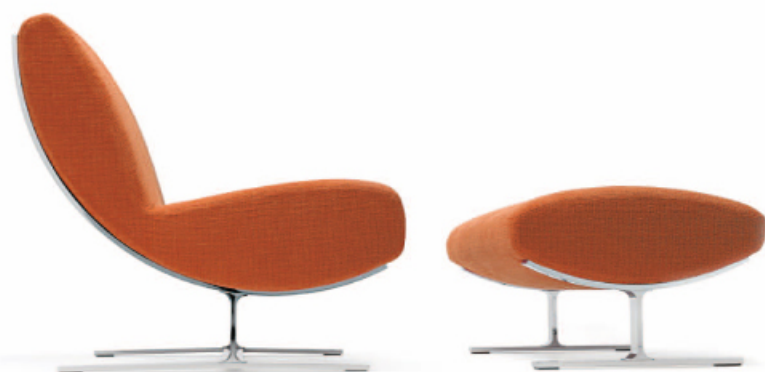
SVENTOLA pour MISURA EMME

Une vraie innovation réinvente le concept de la bibliothèque. Les panneaux qui la composent, en se libérant de leur poids, permettent au rayonnage d'être suspendu, en donnant un sens de "légèreté visuelle".